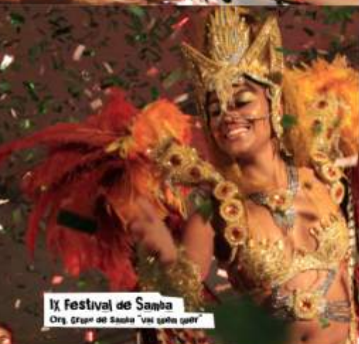
IX Festival de Samba Org. Grupo de Samba "Um Samba Quê"