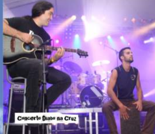
Concerto Diabo na Cruz