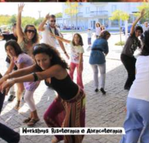
Workshops Risoterapia e Akracoterapia