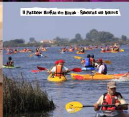
II Passeio Rio Ria em Kayak - Ribeiras de Veiros