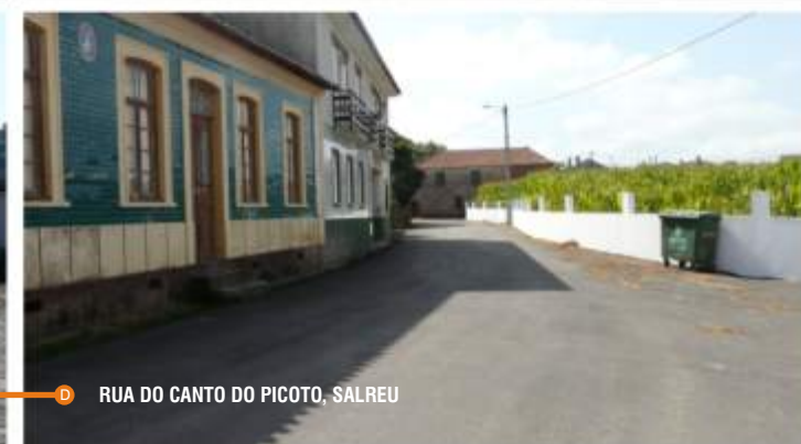
D RUA DO CANTO DO PICOTO, SALREU