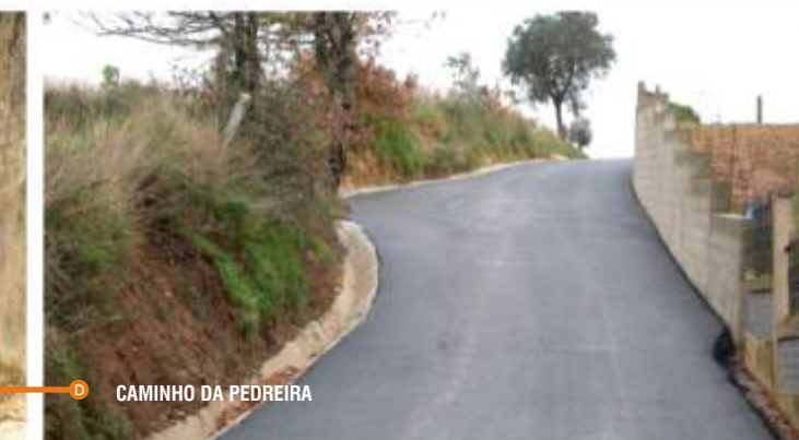
D CAMINHO DA PEDREIRA