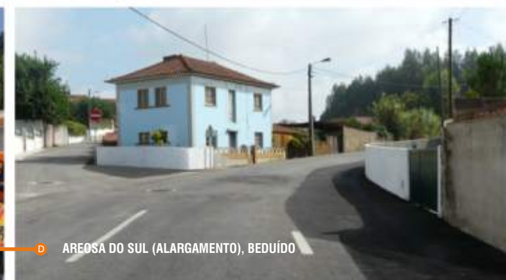
D AREOSA DO SUL (ALARGAMENTO), BEDUÍDO