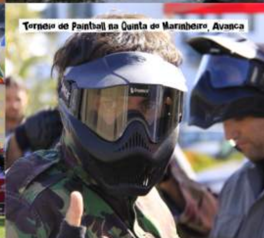
Torneio de Paintball na Quinta do Marinheiro, Avanca