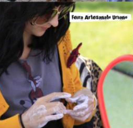
Feira Artesanato Urbano