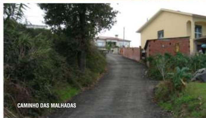
D CAMINHO DAS MALHADAS