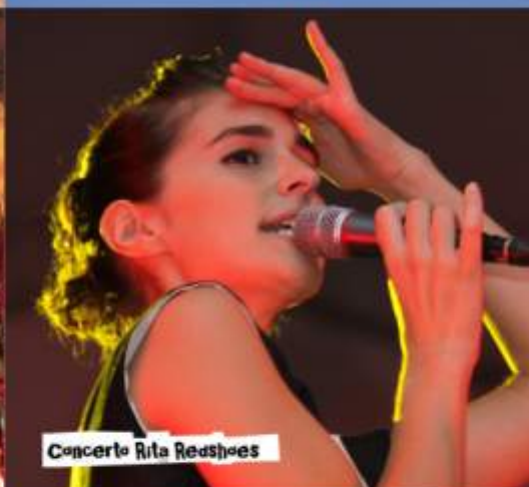
Concerto Rita Redshoes