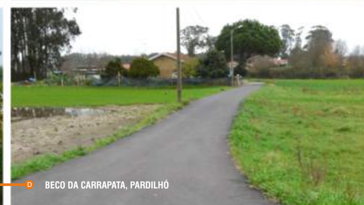
D BECO DA CARRAPATA, PARDILHÓ