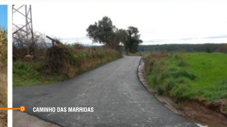
D CAMINHO DAS MARRIDAS