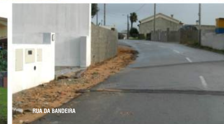
D RUA DA BANDEIRA