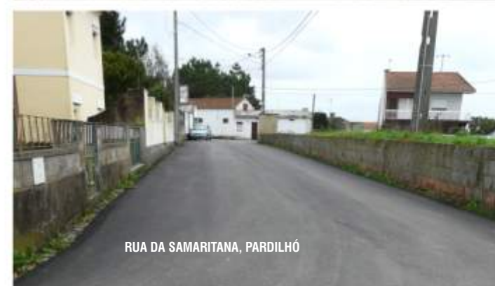
RUA DA SAMARITANA, PARDILHÓ