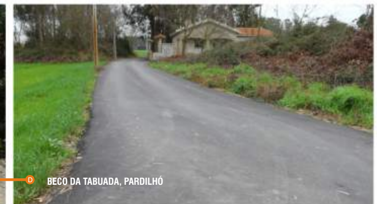
BEÇO DA TABUADA, PARDILHÓ