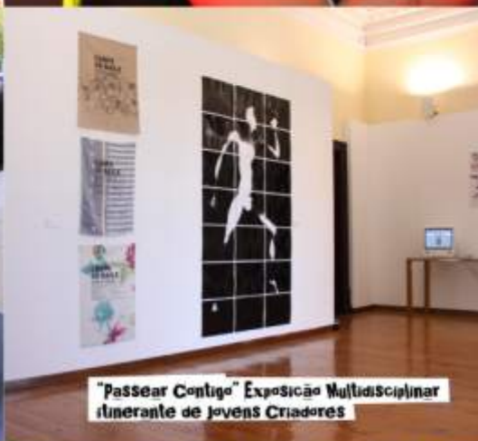
"Passear Contigo" Exposição Multidisciplinar itinerante de jovens Criadores