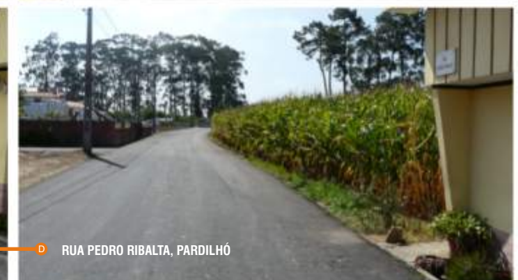
RUA PEDRO RIBALTA, PARDILHÓ