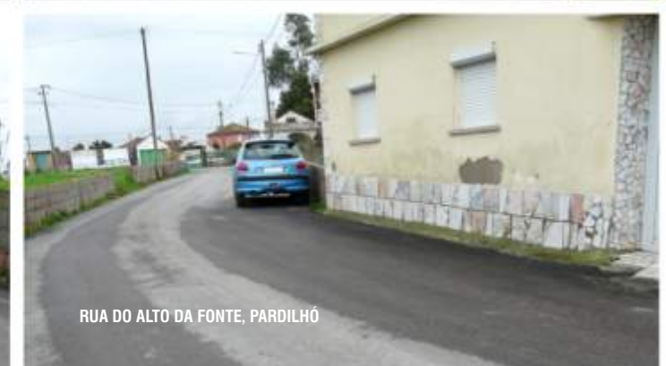
RUA DO ALTO DA FONTE, PARDILHÓ