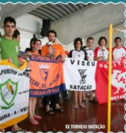
XX TORNEIO NATAÇÃO