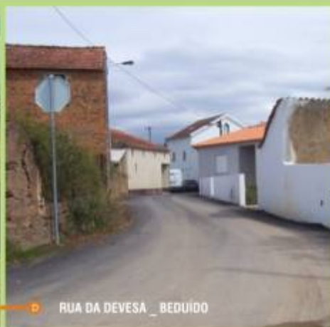
A D RUA DA DEVESA _ BEDUIDO