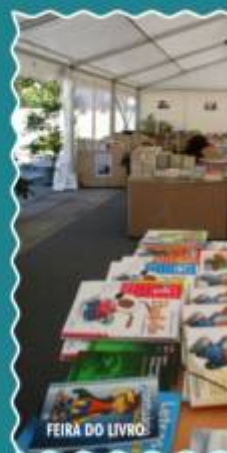
FEIRA DO LIVRO