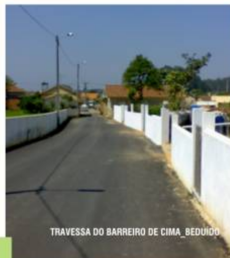
TRAVESSA DO BARREIRO DE CIMA _ BEDUIDO