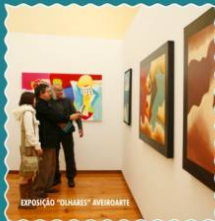
EXPOSIÇÃO "OLHARES" AVEIROARTE