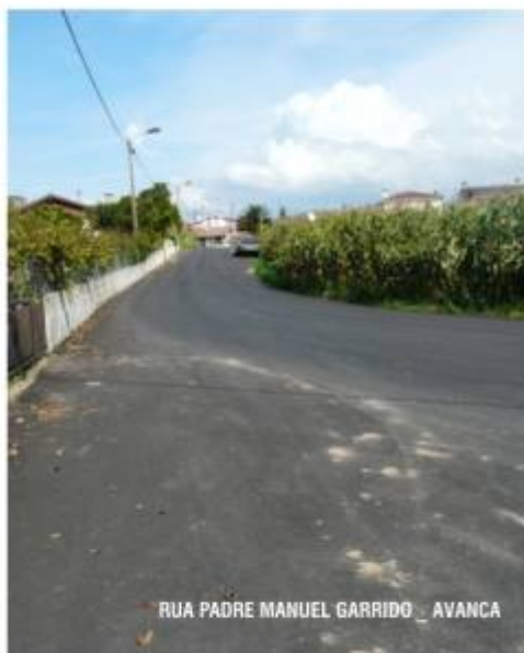
RUA PADRE MANUEL GARRIDO _ AVANCA

A intervenção incluiu pavimentação, drenagem de águas pluviais e arranjo dos passeios. A Câmara Municipal investiu cerca de 80 mil€ nesta empreitada.