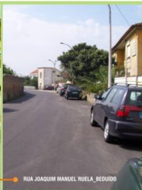
A D RUA JOAQUIM MANUEL RUELA_BEDUÍDO