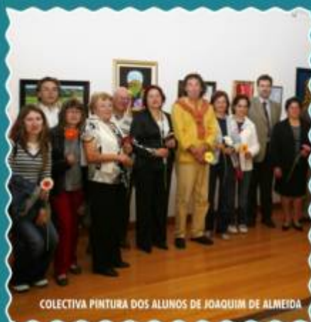
COLECTIVA PINTURA DOS ALUNOS DE JOAQUIM DE ALMEIDA