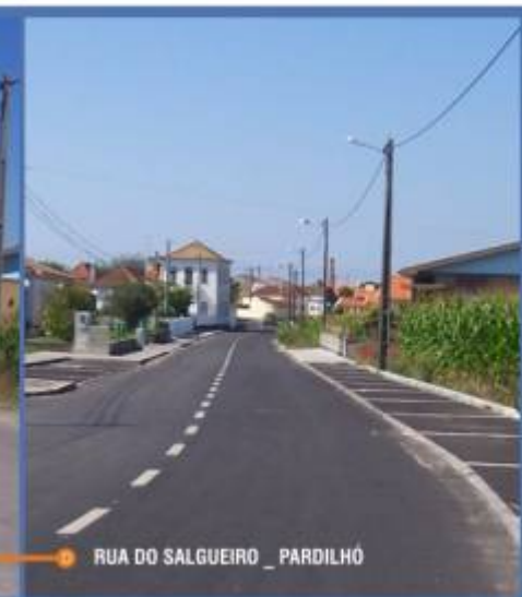
A D RUA DO SALGUEIRO _ PARDILHÓ