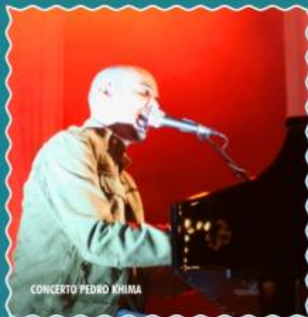
CONCERTO PEDRO KHIMA