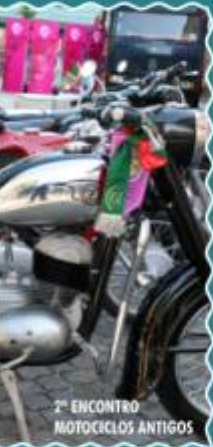
2º ENCONTRO MOTOCICLOS ANTIGOS