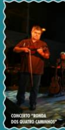
CONCERTO "RONDA DOS QUATRO CAMINHOS"