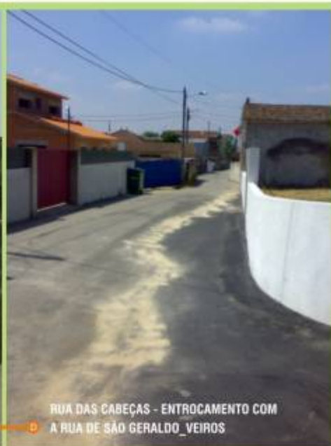
A D RUA DAS CABEÇAS - ENTROCAMENTO COM A RUA DE SÃO GERALDO_VEIROS