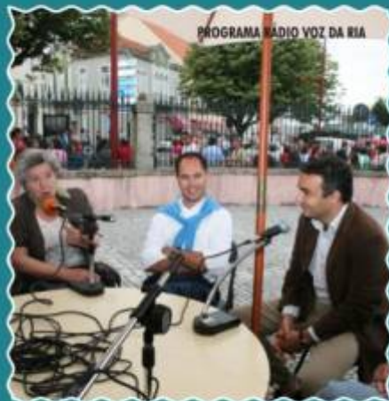
PROGRAMA RÁDIO VOZ DA RIA