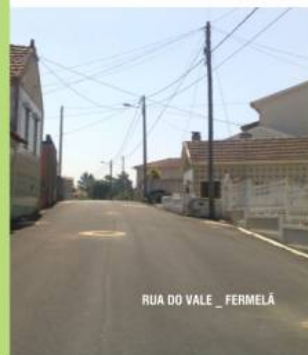
RUA DO VALE _ FERNELA

A Câmara Municipal lançou a concurso nos primeiros oito meses do ano 39 empreitadas de beneficiação de ruas dando seguimento à qualificação e conservação da Rede Viária Municipal. Desse bolo, haviam sido adjudicados 27 concursos correspondendo a um investimento municipal de 467.029€.