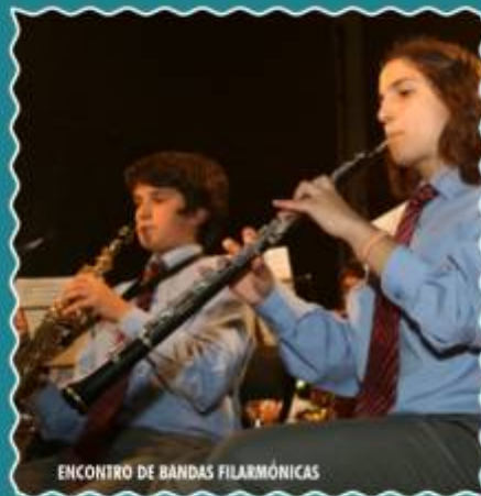
ENCONTRO DE BANDAS FILARMÓNICAS