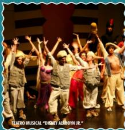
TEATRO MUSICAL "DISNEY ALADDIN JR."