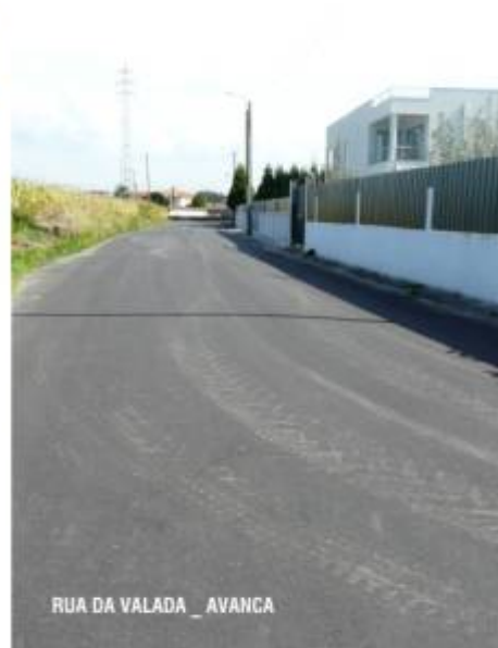
RUA DA VALADA _ AVANCA