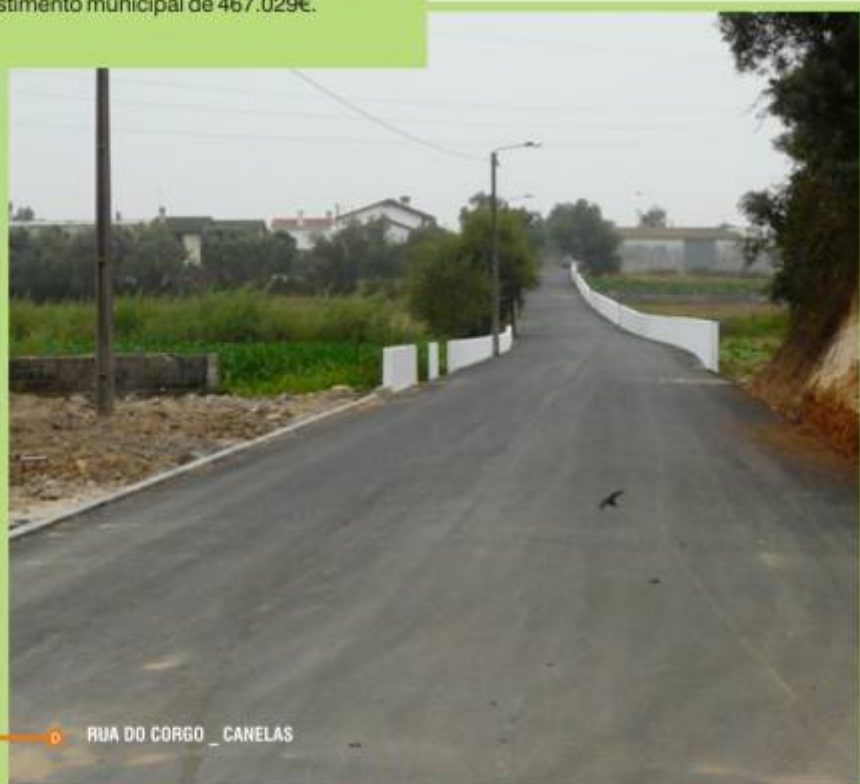
A D RUA DO CORGO _ CANELAS