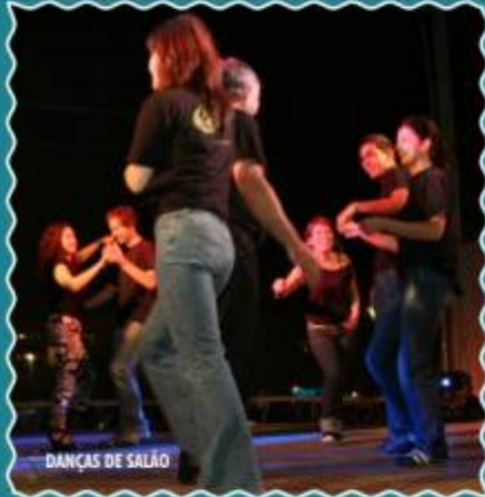
DANÇAS DE SALÃO