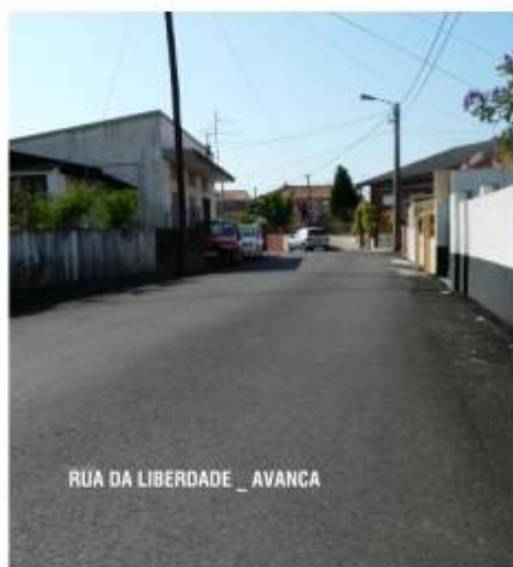
RUA DA LIBERDADE _ AVANCA