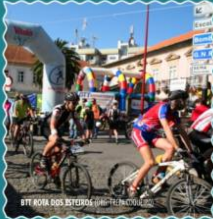
BTT ROTA DOS ESTEIOS 1000 TREM COQUELHO