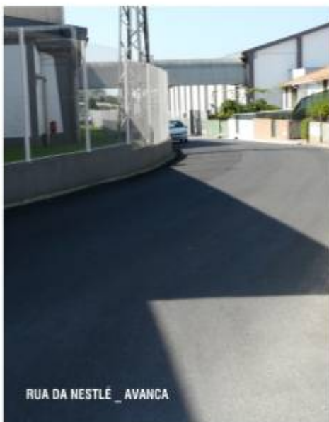
RUA DA NESTLÉ _ AVANCA