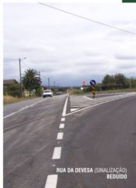
RUA DA DEVESA (SINALIZAÇÃO) BEDUÍDO