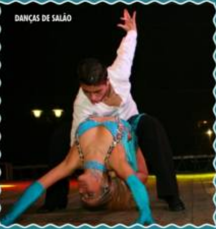
DANÇAS DE SALÃO