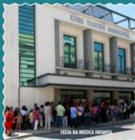
FESTA DA MÚSICA INFANTIL