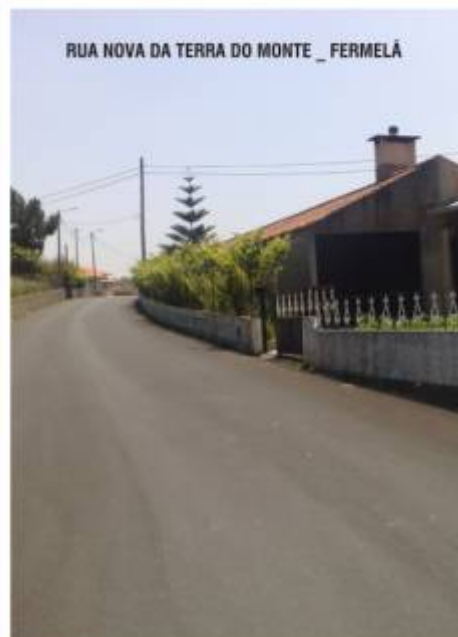
RUA NOVA DA TERRA DO MONTE _ FERMELÃ