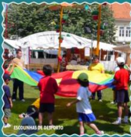
ESCOLINHAS DE DESPORTO