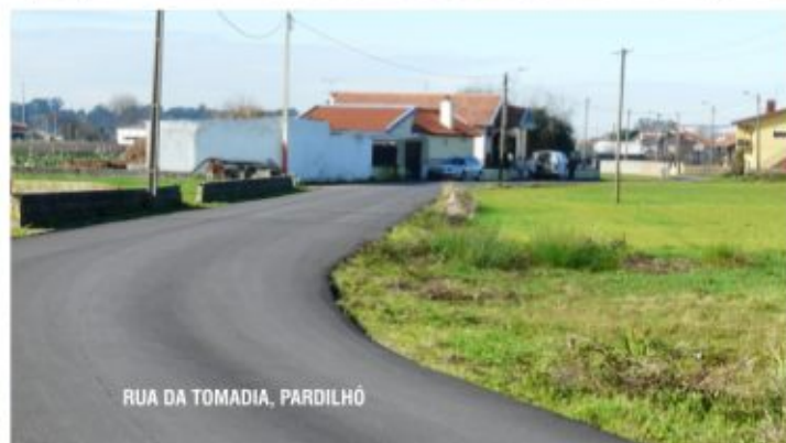
RUA DA TOMADIA, PARDILHÓ