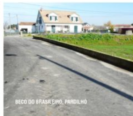
BECO DO BRASILEIRO, PARDILHÓ