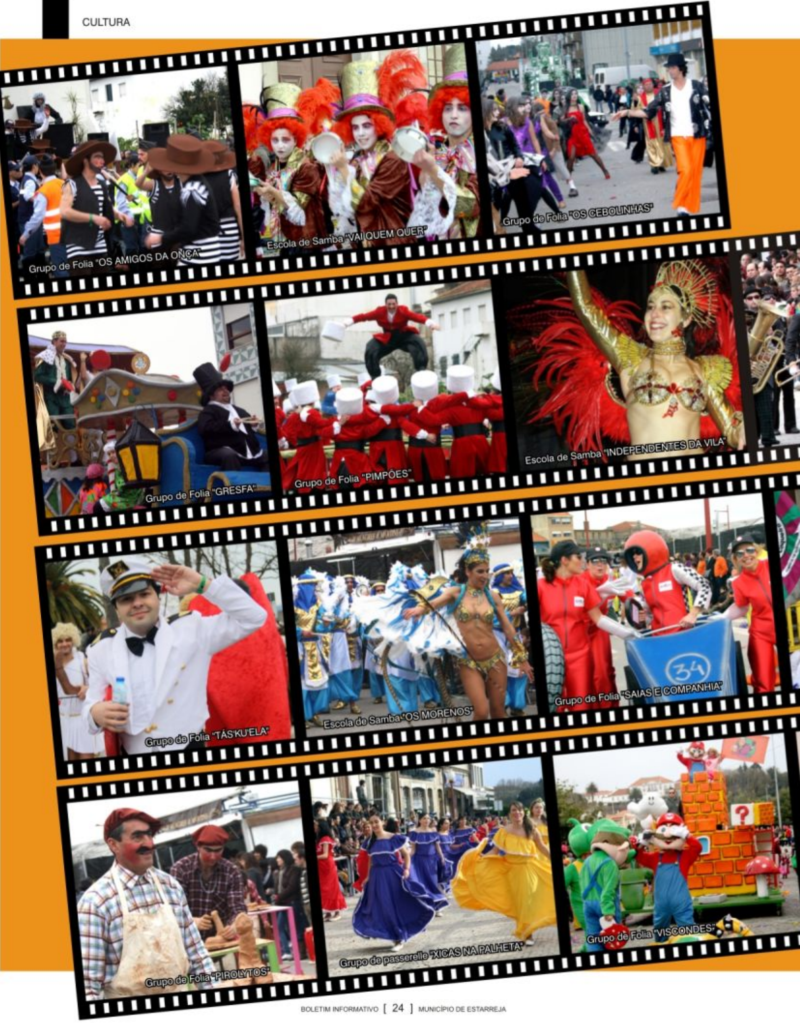
Grupo de Folia "OS AMIGOS DA ONÇA"