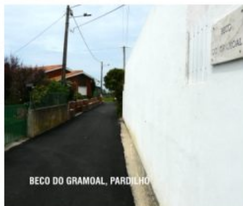
BECO DO GRAMOAL, PARDILHÓ