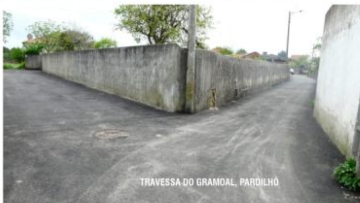
TRAVESSA DO GRAMOAL, PARDILHÓ