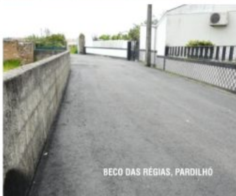
BECO DAS RÉGIAS, PARDILHÓ

Em cima da mesa mantém-se a proposta da autarquia de transferência da EN para a esfera de competência do município, através de um protocolo semelhante ao efectuado para a EN 1-12 (Salreu - Albergaria-a-Velha), salvaguardando a verba para reabilitação da via, onde nos últimos anos apenas a autarquia tem investido.